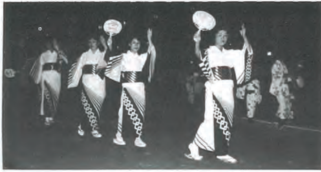
(上) 婦人部による盆踊り