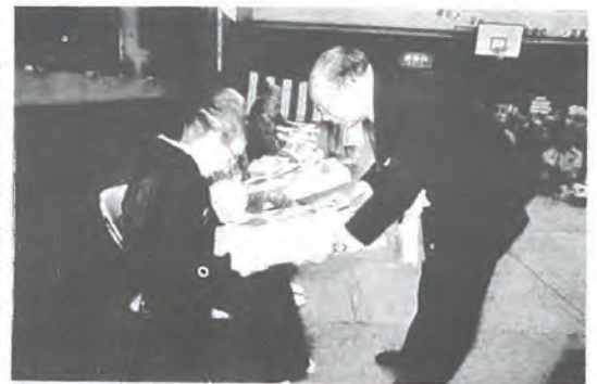
九十才以上の長寿者に 記念品贈呈