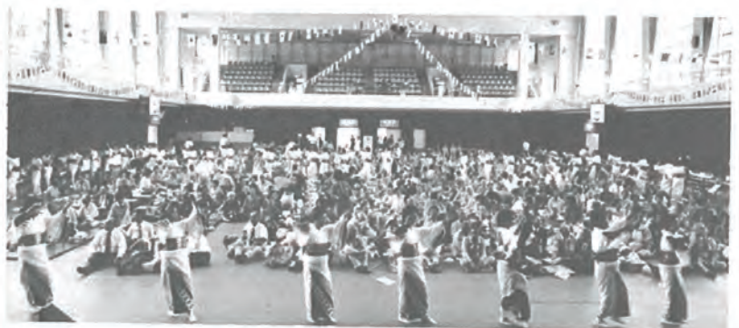
婦人会のみなさんによる 佐々音頭

九月二十六日午前九時から佐々町、町老人クラブ連合会及び町母子の合同主催によるスポーツ大会が台風一過澄みきった秋空の下、多数が参加