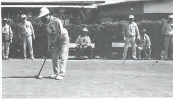
ゲートボールに楽しむ 老人会員の方々

老人保健法が成立し、五十八年二月一日から七〇才以上（寝たきりの場合は六十五才以上）のおとしよりの医療はすべて新しい制度の下に運営されます。現在、おとしよりは、さまざまな医療保険に加入し、その制度の下に医療を受けているわけですが、五十八年二月からは、すべてのおとしよりが老人保健によって