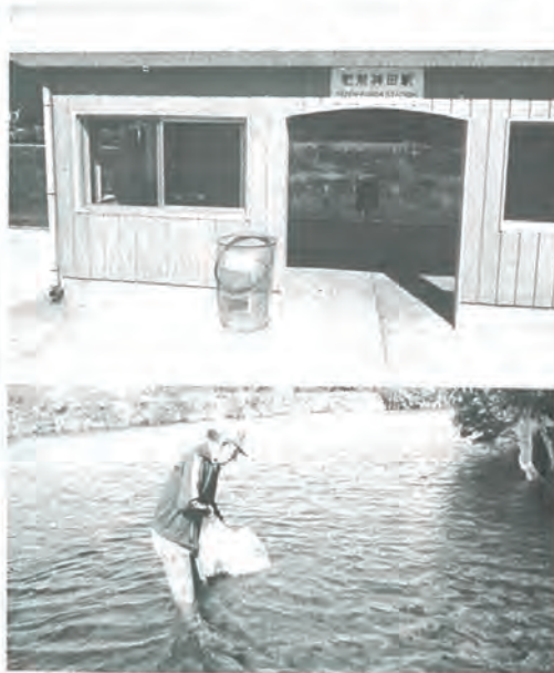
神田駅に設置された空カンボックス(上)と、内水面協議会員の手で佐々川に放流される稚鯉(下)

ックス三個、鯉の稚魚一万匹(佐々地区三千匹)の寄贈をいただきました。さっそく肥前神田駅、小浦駅、住民センター横に設置、又鯉の稚魚は、内水面協議会の方々により佐々川に放流されました。紙面を持ちまして、厚くお礼を申し上げます。