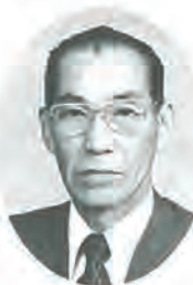
佐々町議会議員 議長

昨年の町政の主な動きを顧みますと、農業振興のための新農業構造改善事業を計画しましたが、なかでも長期的展望にたった農業後継者の育成と、地域に根ざした教育のため「学童農園」の建設を中心