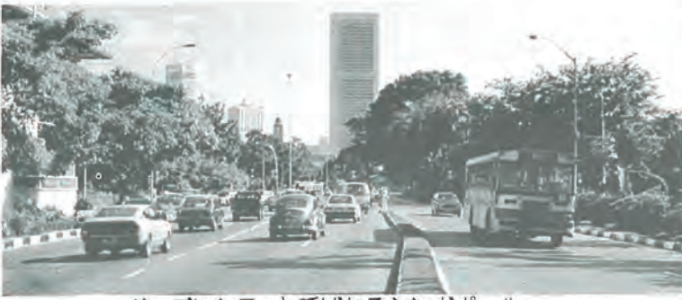
ガーデンシティと呼ばれるシンガポール

昭和五十七年十月二日から同六日まで、長崎、シンガポール定期航空路開設を促進するため、長崎県、長崎国際空港整備期成会などの主催による親善使節団の一行（团长 長崎十八銀行頭取）の一員として参加しましたので、その随行記を次号まで二回にわたり報告します。