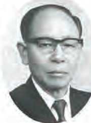
佐々町長 菊本 春夫