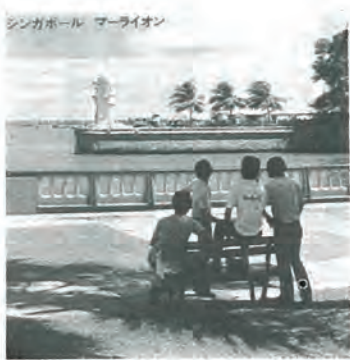
シンガポール マーライオン

日本の大手企業等、金融、建設、商工業等の大手企業も欧米諸国の大手企業と並んで進出している。スーパー、デパート等は、日曜日には五千人、二万人の客を呼んでいることを見聞きし、友好の絆を強