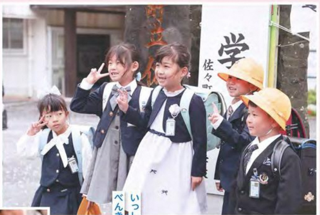
いつしよに ぺんぎょうがんばろうね!