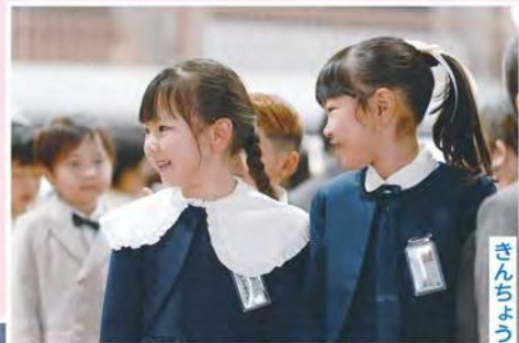
ひらがな きんぎょの おね