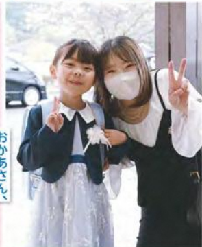
おかあさん、 わたしがんばるね!