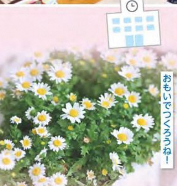
おもいでひまわりだね！ たんせん