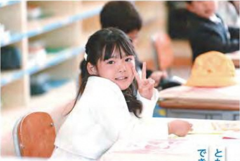
ともだちいつぱい できるかな?