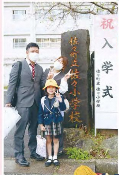
祝 入学式 佐々町立佐々小学校