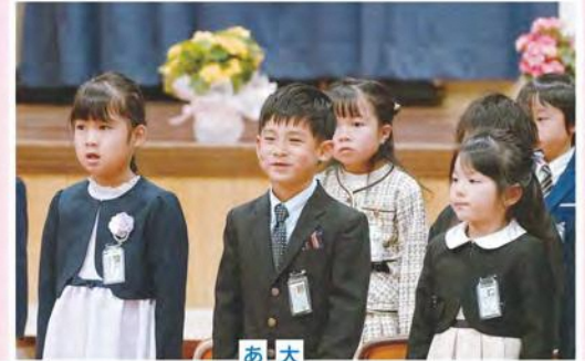
大きな声で あいさつができましたね