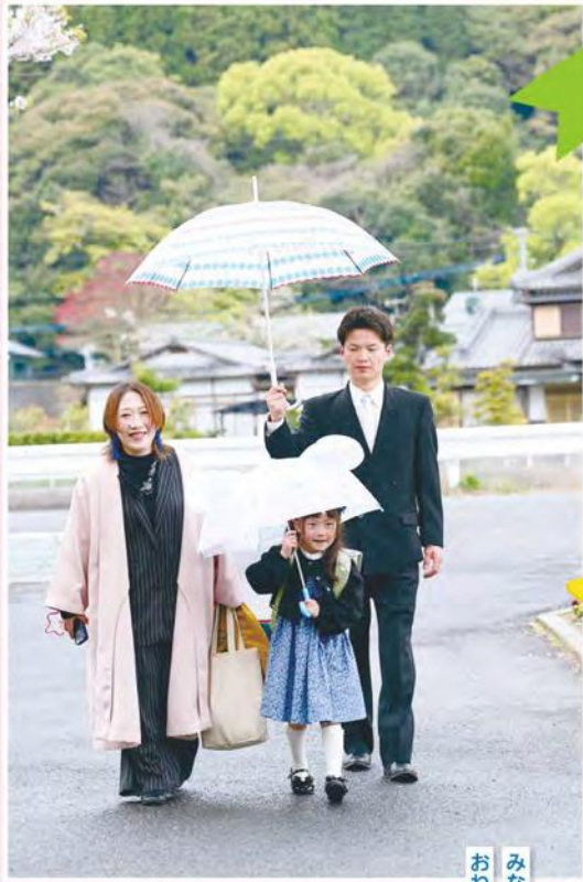
みなさんよろしく おねがいします！