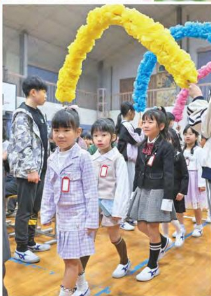
きょうからいちねんせい! ドキドキしてます!