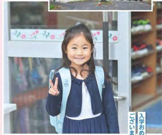
入学おめでとう ございます！