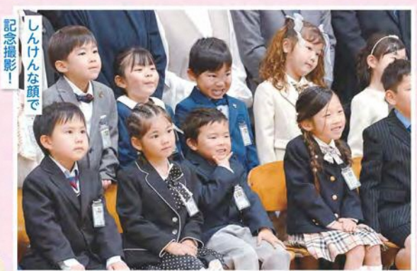
記念撮影! しんげんな顔で