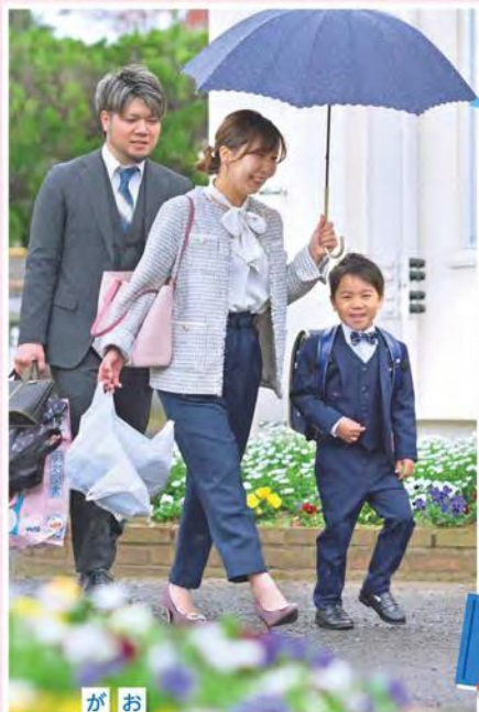
たくさん ぺんぎょうするよ!