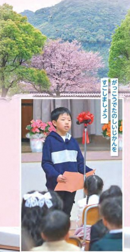
がっこうのたのしいじかんを すこしまじょう