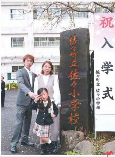
祝 入学式 佐々町立佐々小学校