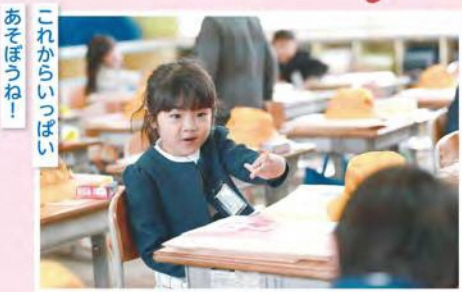
これからいつぱい あそぼつね!