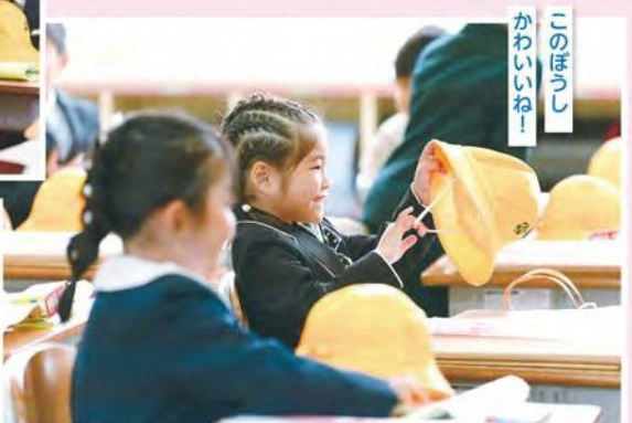
このぼうし かわいいね!